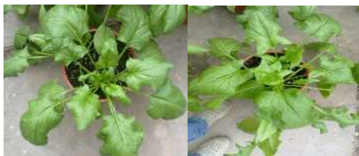
تصویر ۱- مرحله بلوغ تجاری بوته‌های اسفناج

* میانگین‌های دارای حداقل یک حرف مشترک در سطح احتمال ۰.۵٪ آزمون دانکن تفاوت معنی‌داری ندارند.