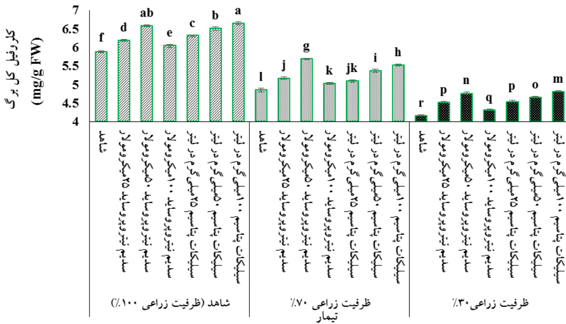
شکل ۲- اثر سدیم نیتروپروساید و سیلیکات پتاسیم بر محتوای کلروفیل کل گیاه رزماری ( Rosmarinus officinalis L.) در شرایط تنش کم‌آبی. ستون‌ها دارای حروف مشابه، براساس آزمون چند دامنه‌ای دانکن و در سطح احتمال پنج درصد، تفاوت معنی‌داری با یکدیگر ندارند (میانگین \pm SD).

است که در این شرایط بیان ژن این آنزیم القا می‌شود (سروری و همکاران، ۱۴۰۱). در گیاه بگونیا پرگل ( Begonia