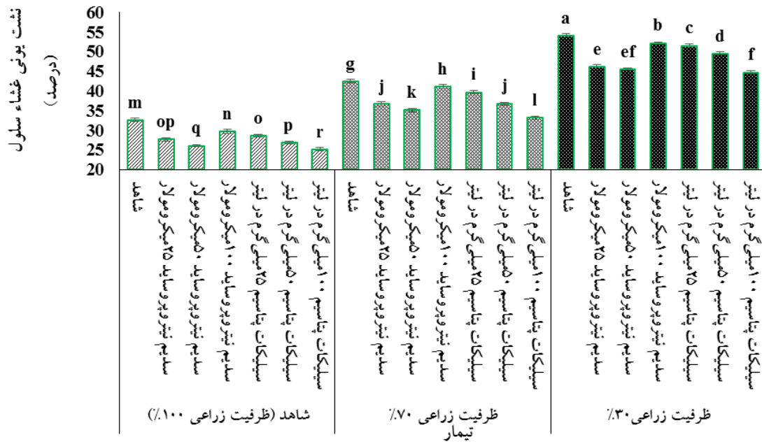
شکل ۱- اثر سدیم نیتروپروساید و سیلیکات پتاسیم بر نشت یونی غشاء سلول گیاه رزماری ( Rosmarinus officinalis L.) در شرایط تنش کم‌آبی. ستون‌ها دارای حروف مشابه، براساس آزمون چند دامنه‌ای دانکن و در سطح احتمال پنج درصد، تفاوت معنی‌داری با یکدیگر ندارند (میانگین \pm SD).