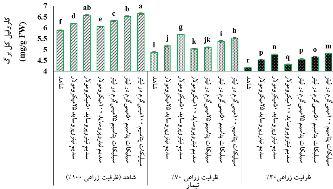
شکل ۲- اثر سدیم نیتروپروساید و سیلیکات پتاسیم بر محتوای کلروفیل کل گیاه رزماری ( Rosmarinus officinalis L.) در شرایط تنش کم‌آبی. ستون‌ها دارای حروف مشابه، براساس آزمون چند دامنه‌ای دانکن و در سطح احتمال پنج درصد، تفاوت معنی‌داری با یکدیگر ندارند (میانگین \pm SD).

است که در این شرایط بیان ژن این آنزیم القا می‌شود (سروری و همکاران، ۱۴۰۱). در گیاه بگونیا پرگل ( Begonia