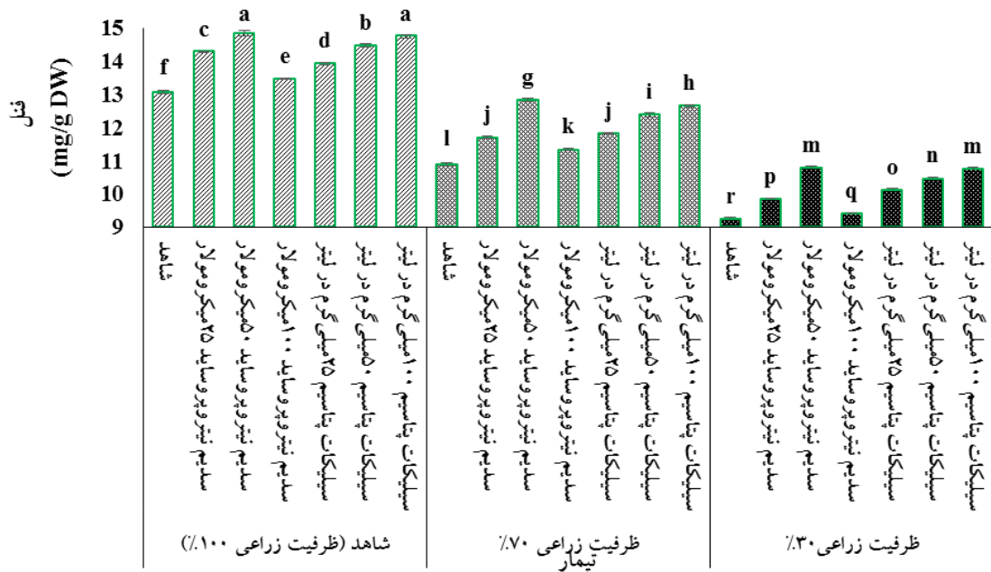
شکل ۳- اثر سدیم نیتروپروساید و سیلیکات پتاسیم بر میزان فنل گیاه رزماری ( Rosmarinus officinalis L.) در شرایط تنش کم آبی. ستون‌ها دارای حروف مشابه، براساس آزمون چند دامنه‌ای دانکن و در سطح احتمال پنج درصد، تفاوت معنی‌داری با یکدیگر ندارند (میانگین \pm SD).