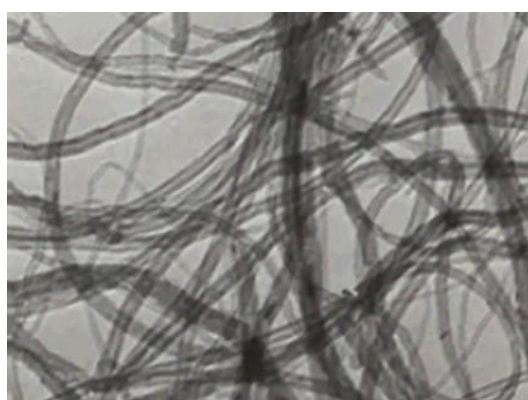
TEM: Transmission electron microscopy, BET: Brunauer -emmett - teller surface area analysis, CVD: Chemical vapor deposition

محلول‌پاشی ۲۰ روز پس از انتقال قلمه‌ها انجام شد. حجم نهایی محلول پاشیده‌شده برای هر گیاه ۲/۵ میلی‌لیتر بود که معادل ۰/۲۵، ۰/۵، ۱، ۱/۵ و ۲ گرم نانولوله بود. در تیمار شاهد، گیاهان تنها با آب مقطر تقطیر محلول‌پاشی شدند. انتخاب غلظت‌های آزمایشی براساس گزارش‌های پیشین در زمینه استفاده از نانومواد کربنی برای بهبود رشد و افزایش محتوای متابولیت‌های ثانویه در گیاهان انجام شد (Prakash et al., 2025).