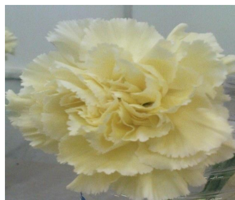
شکل ۱- چیدمان واحدهای آزمایشی در اتاق عمر گلجایی (شکل بالا)، گل شاخه بریده میخک سالم (شکل پایین، سمت راست) و میخک پژمرده (شکل پایین، سمت چپ)

و سپس در غلظت‌های تعیین شده با ۳۰۰ میلی لیتر آب مقطر اضافه شدند. گل‌ها به مدت ۲۴ ساعت در محلول نگهدارنده حاوی عصاره‌ها و اسانس‌های گیاهی (تیمارها) قرار داده و پس از ۲۴ ساعت به محلول نگهدارنده دیگر شامل آب و ساکارز منتقل شده و تا آخر عمر گلجایی، در محلول دوم بودند. شرایط نوری آزمایشگاه، ۱۲ میکرومول بر ثانیه بر مترمربع، رطوبت نسبی ۶۵ تا ۷۰ درصد و دمای ۲۰ تا ۲۲ درجه سانتی‌گراد و طول روز ۱۲ ساعت بود.