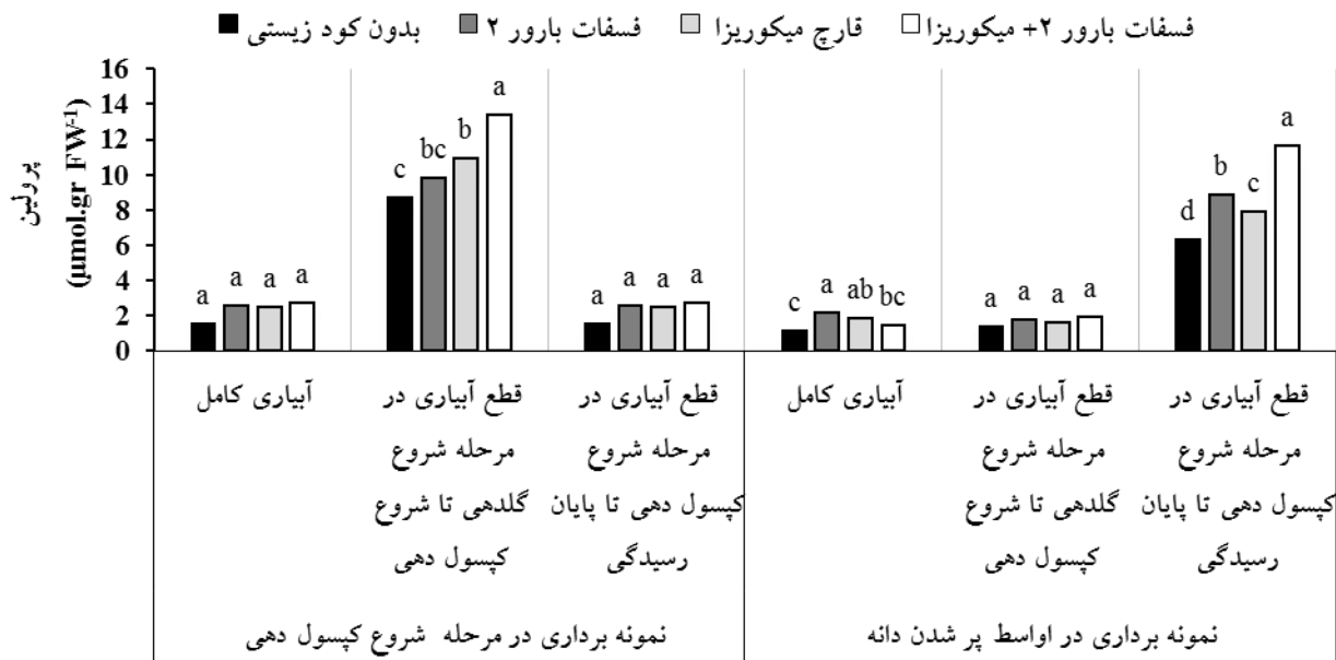
شکل ۲- اثر برهمکنش رژیم‌های آبیاری و کودزیستی بر میزان پرولین برگ. براساس تجزیه واریانس برش‌دهی در هر سطح آبیاری، ستون‌هایی که دارای حداقل یک حرف مشترک بوده براساس آزمون Lsmeans در سطح خطای (۵٪) اختلاف معنی‌داری ندارند.

کپسول‌دهی افزایش ۷۴/۱ درصدی را نسبت به آبیاری کامل، در صفت مذکور ایجاد کرده است (جدول ۶). در نمونه‌برداری در مرحله پر شدن دانه، بیشترین غلظت قندهای محلول برگ (۵۱/۱ میلی‌گرم بر گرم) در تیمار قطع آبیاری در مرحله شروع کپسول‌دهی تا پایان رسیدگی و کمترین غلظت قندهای محلول (۳۰/۴ میلی‌گرم بر گرم) در تیمار قطع آبیاری در مرحله شروع گلدهی تا شروع کپسول‌دهی به دست آمد که با تیمار آبیاری کامل (۳۴/۲ میلی‌گرم بر گرم) تفاوت معنی‌داری نداشت (جدول ۶). مقایسه میانگین سطوح کودزیستی نشان داد در نمونه‌برداری در هر دو مرحله بیشترین غلظت قندهای محلول در تیمار مایکوریزا + فسفات بارور ۲ به دست آمد و کمترین غلظت قندهای محلول در تیمار بدون کود زیستی به دست آمد و کاربرد تلفیقی کود زیستی فسفات بارور ۲ و قارچ مایکوریزا در نمونه‌برداری در مرحله شروع کپسول‌دهی و پر شدن دانه به ترتیب افزایش ۲۱/۴ و ۲۱ درصدی را نسبت به تیمار بدون کودزیستی، در این صفت ایجاد کرده است (جدول ۶).