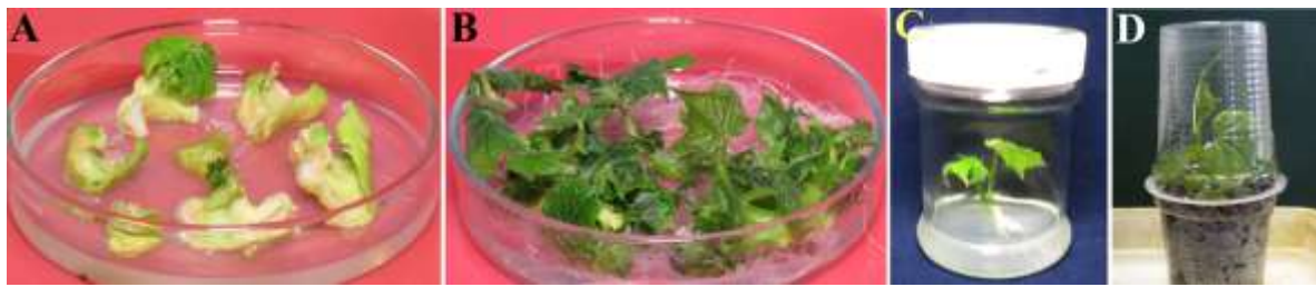
شکل ۱- نتایج اندام‌زایی از ریزنمونه‌های برگ‌بذری خیار رقم "بت‌آلفا". (A) در محیط A0S0C0 (بدون ABA) (B) در محیط A1S0C2 (دارای ABA و سفوتاکسیم) (C) شاخساره ریشه‌دار شده در محیط R2 (حاوی ۰/۱ میلی‌گرم در لیتر IBA). (D) مرحله سازگارسازی گیاهچه.