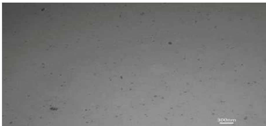
شکل ۲- تصویر میکروسکوپ الکترونی عبوری از نانوذرات اکسید روی سنتز شده توسط عصاره زیتون.