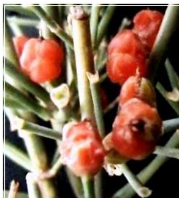
شکل ۱- میوه مانند قرمز ارمک میانه