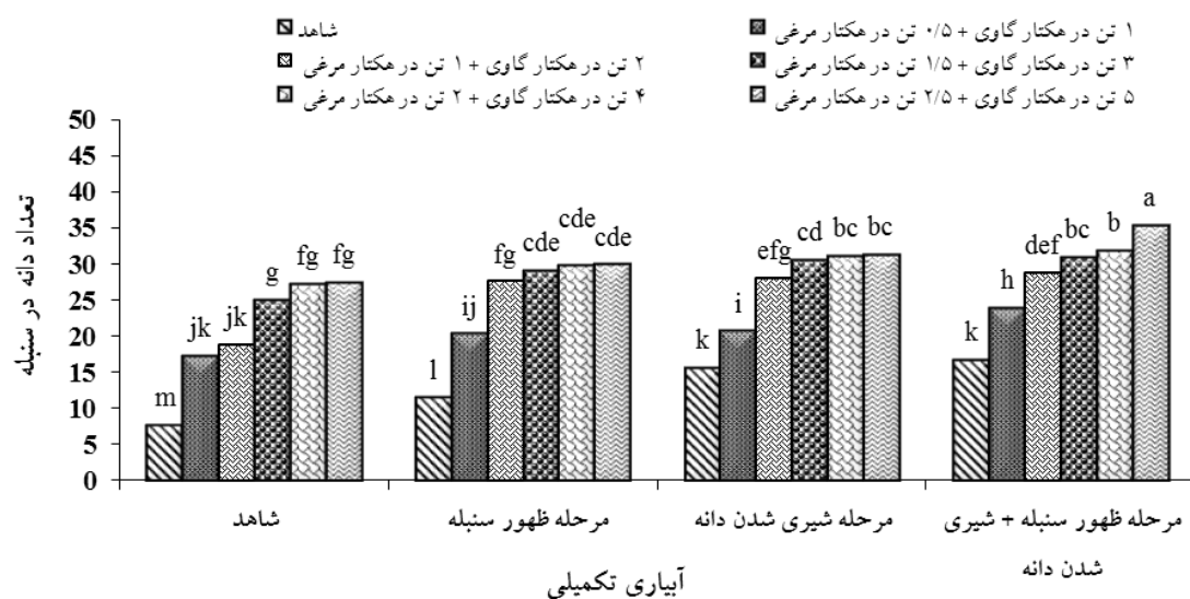
شکل ۱- اثر متقابل آبیاری تکمیلی × کاربرد کودهای آلی بر تعداد دانه در سنبله (حروف متفاوت در ستون‌ها نشان‌دهنده تفاوت معنی‌دار براساس آزمون LSD است).

ns، * و ** به ترتیب غیرمعنی دار، معنی دار در سطوح احتمال خطای پنج و یک درصد