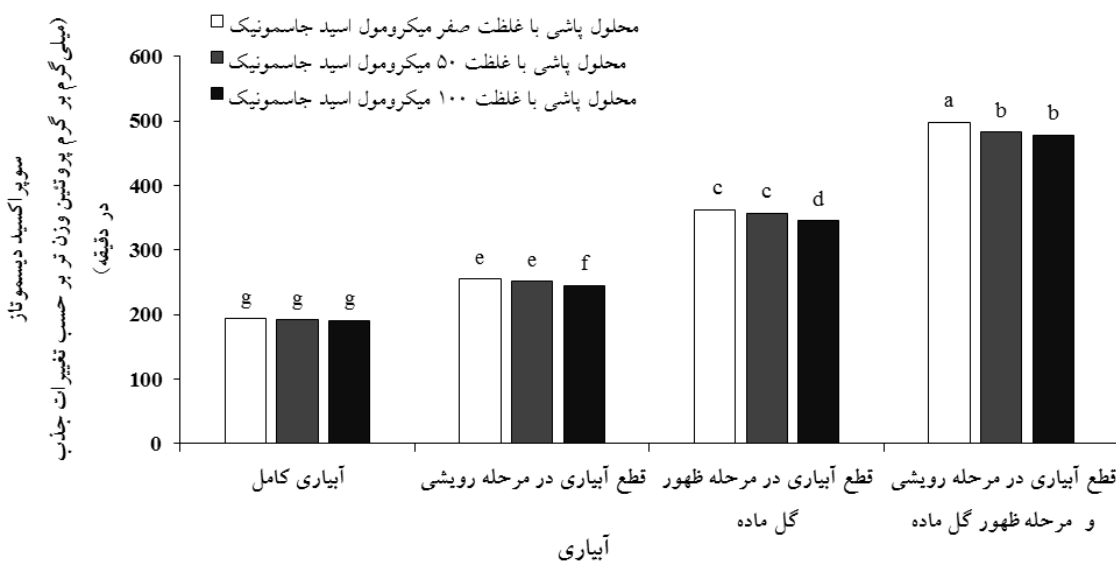
شکل ۲- مقایسه فعالیت آنزیم سوپراکسید دیسموتاز برگ تحت تأثیر برهمکنش سطوح آبیاری و محلول پاشی اسید جاسمونیک. حروف مشابه، فاقد اختلاف معنی دار در سطح احتمال ۵٪ (براساس آزمون LSD) هستند.

گونه‌های فعال اکسیژن (ROS) که تحت شرایط خشکی در بافت گیاه افزایش می‌یابند، مقابله می‌کنند. افزایش فعالیت این آنزیم‌ها تحت تنش خشکی در برنج آپلند (Lum et al. , 2014)، نخود (Kumar et al. , 2011) و گندم (Hasheminasab et al. , 2012) گزارش شده است که حاکی از تعادل بین تولید رادیکال‌های آزاد و میزان فعالیت سیستم آنتی‌اکسیدانی گیاه