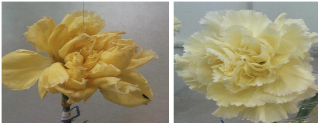
شکل ۱- چیدمان واحدهای آزمایشی در اتاق عمر گلجایی (شکل بالا)، گل شاخه بریده میخک سالم (شکل پایین، سمت راست) و میخک پژمرده (شکل پایین، سمت چپ)

و سپس در غلظت‌های تعیین شده با ۳۰۰ میلی لیتر آب مقطر اضافه شدند. گل‌ها به مدت ۲۴ ساعت در محلول نگهدارنده حاوی عصاره‌ها و اسانس‌های گیاهی (تیمارها) قرار داده و پس از ۲۴ ساعت به محلول نگهدارنده دیگر شامل آب و ساکارز منتقل شده و تا آخر عمر گلجایی، در محلول دوم بودند. شرایط نوری آزمایشگاه، ۱۲ میکرومول بر ثانیه بر مترمربع، رطوبت نسبی ۶۵ تا ۷۰ درصد و دمای ۲۰ تا ۲۲ درجه سانتی‌گراد و طول روز ۱۲ ساعت بود.