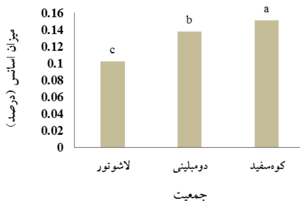
شکل ۴- مقایسه میانگین اثر ساده جمعیت بر میزان اسانس

** همبستگی در سطح ۰/۰۱ و * همبستگی در سطح ۰/۰۵ معنی دار است.