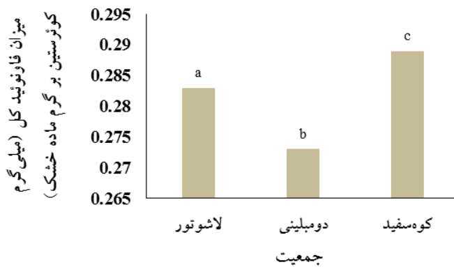
شکل ۲- مقایسه میانگین اثر ساده جمعیت بر میزان فلاونوئید کل

آنتی اکسیدانی و میزان متابولیت‌های ثانویه گیاهان دارویی مانند ترکیبات فنلی و فلاونوئیدها می‌شوند (Medini et al., 2014). بر اساس نتایج می‌توان استنباط کرد که میزان فنل، فلاونوئید کل و فعالیت آنتی اکسیدانی گونه دارویی مینای اصفهانی تحت