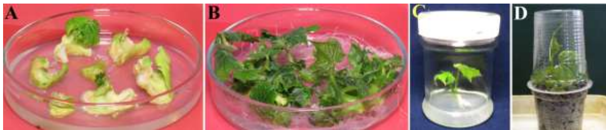
شکل ۱- نتایج اندام‌زایی از ریزنمونه‌های برگ‌بذری خیار رقم "بت‌آلفا". (A) در محیط A0S0C0 (بدون ABA) (B) در محیط A1S0C2 (دارای ABA و سفوتاکسیم) (C) شاخساره ریشه‌دار شده در محیط R2 (حاوی ۰/۱ میلی‌گرم در لیتر IBA). (D) مرحله سازگارسازی گیاهچه.

جدول ۲- تأثیر محیط‌های مختلف بر روی درصد القاء شاخساره و تعداد شاخساره باززایی شده در هر تکرار در ارقام "بت‌آلفا" و "دستگردی" بعد از پنج هفته