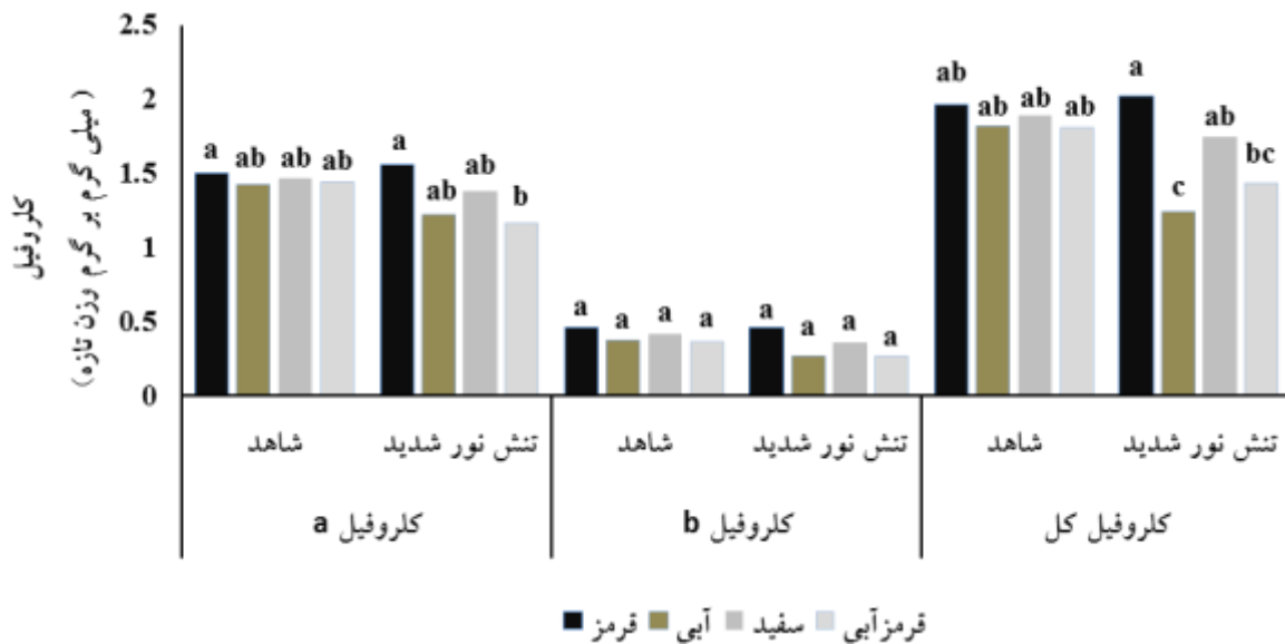
شکل ۲- اثر طیف‌های مختلف نوری و تنش نور شدید بر روی کلروفیل a, b و کلروفیل کل. حروف یکسان بیانگر عدم اختلاف معنی دار در سطح احتمال ۵ درصد با استفاده از آزمون دانکن می‌باشد.