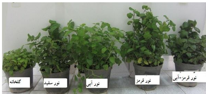
شکل ۳- مقایسه رشد گیاهچه‌های بادرنجبویه تحت تأثیر طیف‌های مختلف نور سفید، آبی، قرمز و ترکیب نور قرمز و آبی در انکوباتور LED با گلخانه.

بالتر بود (شکل ۴). بیشترین میزان رزمارینیک اسید در نور قرمز به میزان ۴/۶۱۶ میکرومول بر گرم وزن خشک بود. در مقایسه با نور گلخانه نور LED قرمز سبب افزایش ۴۴/۵۲ درصدی میزان رزمارینیک اسید و در مقایسه با نور LED سفید