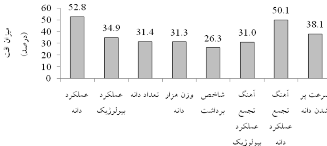
شکل ۲- افت صفات مورد مطالعه در ارقام گندم نان در اثر قطع آبیاری

شده است (Foulkes et al. , 2001; Foulkes et al. , 2006). با توجه به اینکه شاخص برداشت از تقسیم عملکرد دانه به عملکرد بیولوژیک بدست می‌آید و از آنجا که قطع آبیاری پس از گل‌دهی عملکرد دانه را با شدت کاهش می‌دهد، کاهش شاخص برداشت دور از انتظار نمی‌باشد (امام و نیک‌نژاد، ۱۳۹۰).